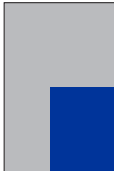
A5 171 x 210 mm