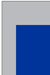
A4 228 x 297 mm