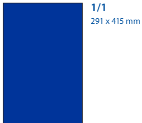
1/1 291 x 415 mm